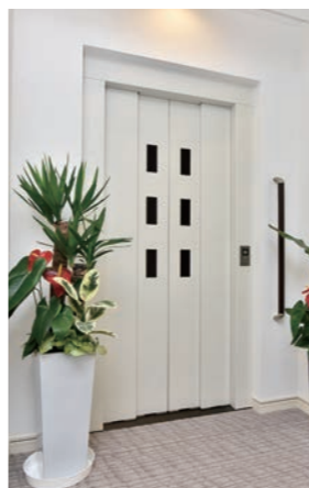
▲バリアフリーエレベーター