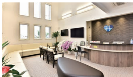
◀スムーズに移動ができる開放的で明るい待合ロビー

をつきながら歩行の練習をする姿などをイメージするかもしれませんが、骨折の場合は折れた箇所をくっつけて、正しく機能するために歩行などの練習を行います。心臓リハビリテーションの場合も同じように、ダメージを受けた心臓ができるだけ早く正しく機能し、元気になるように行うためのリハビリを心臓リハビリテーションといいます。対象は心筋梗塞や狭心症や心不全を起した患者さん、心臓外科手術などを受けた患者さんなどです。心臓リハビリテーションは死亡率を56%減少させ、再発を28%減らすとされています。」