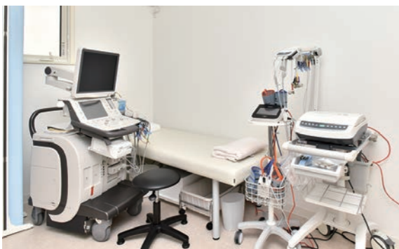
▲最新の心臓エコー室