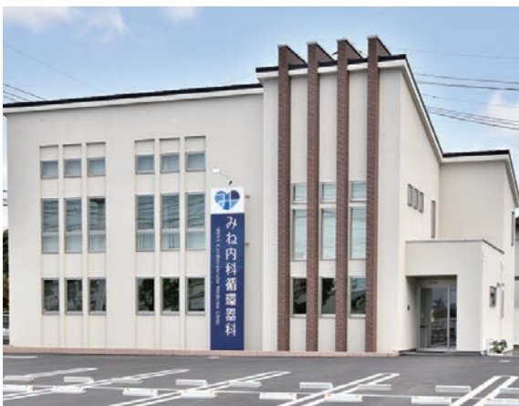
▲佐賀県警察本部(佐賀北警察署)南に、みね内科循環器科クリニックがオープン!