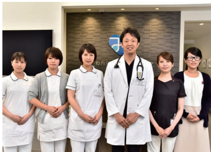
▲患者さんに真摯に接してくださるスタッフさん